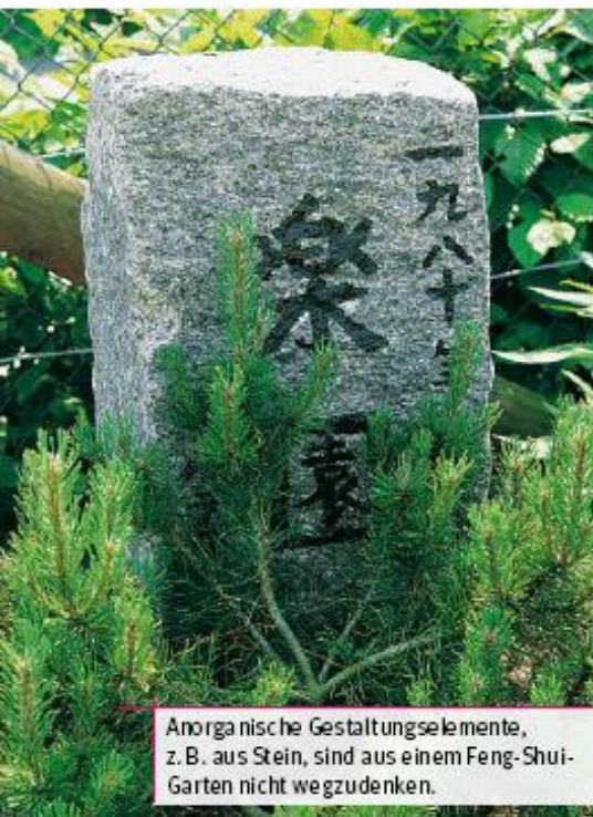
Anorganische Gestaltungselemente, z. B. aus Stein, sind aus einem Feng-Shui-Garten nicht wegzudenken.