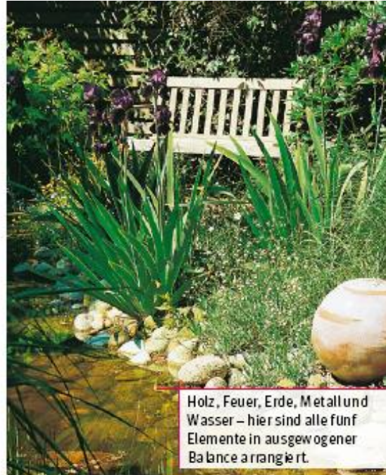
Holz, Feuer, Erde, Metall und Wasser – hier sind alle fünf Elemente in ausgewogener Balance arrangiert.

Ein weiteres Prinzip der asiatischen Gartengestaltung besagt, dass nicht alles auf einmal zu sehen sein soll. Die einzelnen Gartenbereiche sollten sich – einer nach dem anderen – ganz langsam erschliessen. Hierzu zählt auch die Gestaltung der Wege. Schnurgerade, lineare Formen sind im Feng Shui unerwünscht, da sich auf ihnen zu viel aggressives «Sha» (übermässig konzentriertes Qi) ballt. Der ideale Feng-Shui-Gartenweg besteht aus Naturmaterialien, ist sanft geschwungen und passt sich leichtfüssig der Landschaft an. Seine Ränder sind von üppigen Polsterstauden überwachsen, und immer wieder führt er an einen Platz, wo es eine «Überraschung» gibt – einen gemütlichen Sitzplatz, einen interessanten Findling oder einen Brunnen. Wasser ist ein äusserst wichtiger Fak-