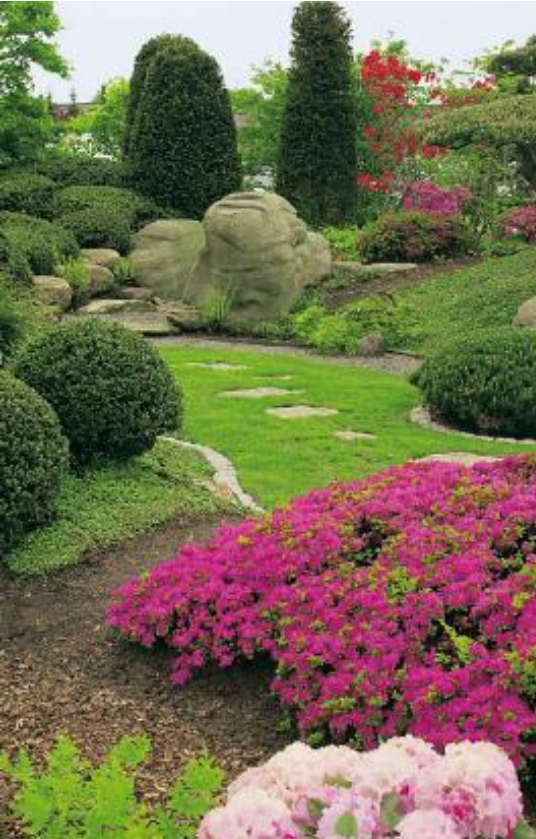
Perfekte Harmonie: Prächtig blühende Azaleen, kombiniert mit üppigem Grün und imposanten Findlingen.