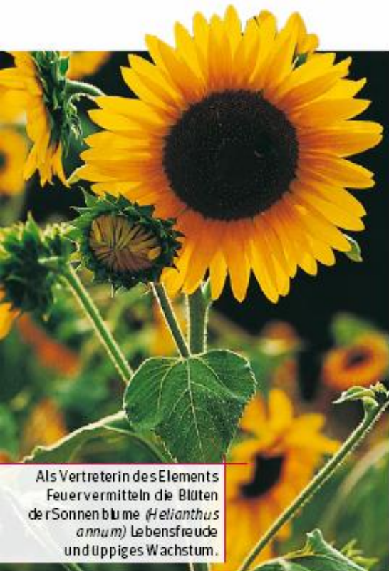
Als Vertreterin des Elements Feuertreiben die Blüten der Sonnenblume ( Helianthus annuus ) Lebensfreude und üppiges Wachstum.