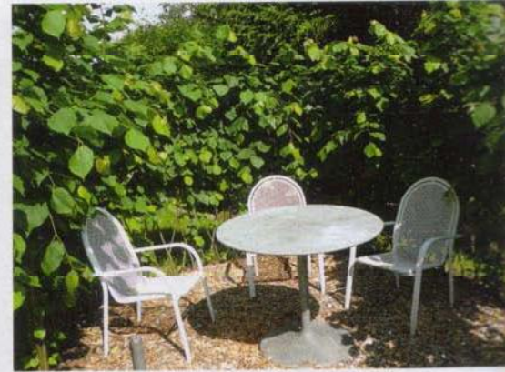
Eine geschützte Sitzecke bildet diese geflochtene Lindenlaube

Für Gartenlauben gibt es keine vorgefertigte Form. Mit etwas Ideenreichtum und Kreativität lässt sich nahezu jede Gartenecke in ein grünes Refugium umwandeln. Rechtwinklig zueinan-