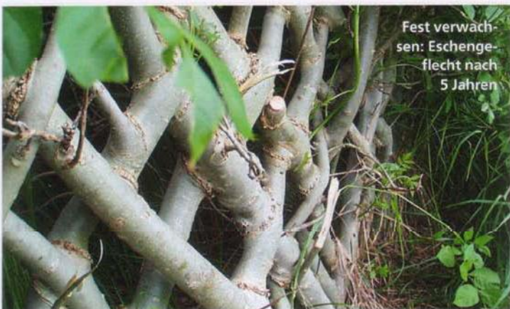
Fest verwachsen: Eschengeflecht nach 5 Jahren

Wichtig bei der Gestaltung ist, dass sich Material und Bauweise an den Charakter des Gartens anpassen. Eine rustikale Laubenbank aus Naturhölzern ist in streng formalen Gärten fehl am Platz. Sie gehört in naturbelassene, „romantischere“ Gärten. Weitere Vorüberlegungen betreffen den Bodenbelag sowie die Befestigung der tragenden Konstruktion. Wird man sich oft in der Laube aufhalten, sollte kein Rasen gesät werden. Unter häufigem Darüberlaufen wird er leiden, und die fehlende Sonnenbestrahlung wird ihr Übriges tun. Besser ist ein fester Belag aus Klinker, Kies, Natursteinplatten oder Rundholzpflaster – gängige Terrassenbeläge also. Tragende Holzkonstruktionen sollten imprägniert werden oder aus witterungsbeständigen Hölzern