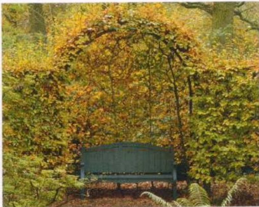
In diese Buchenhecke ist eine kleine Sitzecke integriert

lungen über Klettergerüste winden (bzw. an ihnen haften), sind der ungestüme Knöterich, die Kletterhortensie, die Akebie, die Jungfernebe, das Geißblatt oder die unschlagbar schöne Glyzinie (vgl. hierzu auch GARTEN+HAUS 5/2009).