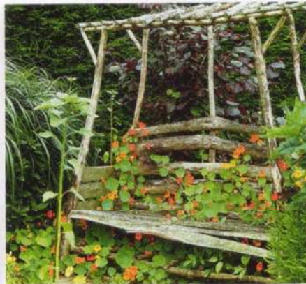
Stimmungsvolle Laubenbank mit wild wuchernder Kapuzinerkresse

Zu wenig Platz sollte dem Laubenglück keineswegs im Wege stehen. Manche Lauben beste-