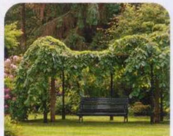
Hängebaum – Blickfang auch in formalen Gärten

Die einfachste Ausführung ist denkbar schlicht und quasi umsonst zu errichten. Wird der Platz gekiest oder gepflastert, muss ein Fundament ausgehoben werden, das zu 2/3 mit verdichtetem Schotter, zu 1/3 mit Kies gefüllt wird. Darauf werden die Steine oder Platten verlegt. !