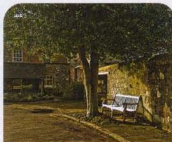
Baum – individueller, naturnaher Sitzplatz

geschickt ist, der kann aus Kanthölzern und Latten ein Bett mit Spalierdach bauen. Solch eine mobile Liegewiese, mit Prunkwinden oder Edelwicken überwachsen, ist nicht nur ein origineller Blickfang. Allein oder zu zweit lässt sich hier gemütlich im Schneidersitz speisen, und für ein Verdauungsnickerchen reicht der Platz allemal. Wem ein „Laubenbett“ wie dieses zu rustikal erscheint, der kann seine Hollywood-Schaukel mit einem Blätter- oder Holzdach kombinieren und solcherart zu einer „Schau-