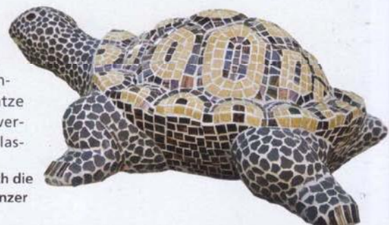
Tierisch: Wie Reptilienschuppen legen sich die Mosaiksteinchen um den Schildkrötenpanzer