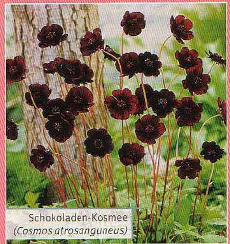
Schokoladen-Kosmee ( Cosmos atrosanguineus )