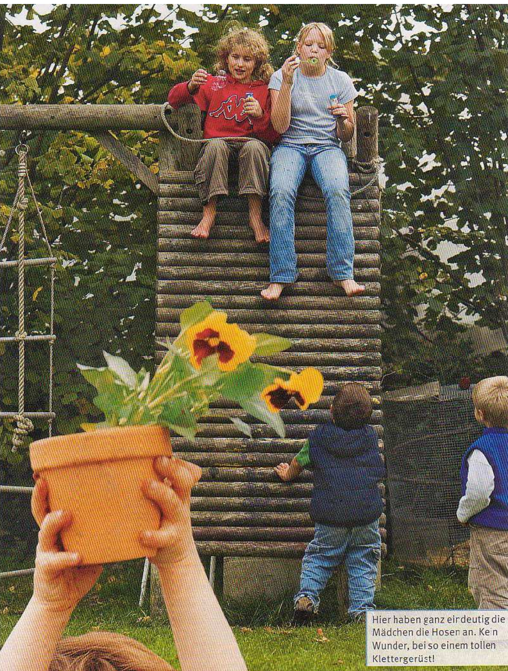
Hier haben ganz eindeutig die Mädchen die Hosen an. Kein Wunder, bei so einem tollen Klettergerüst!