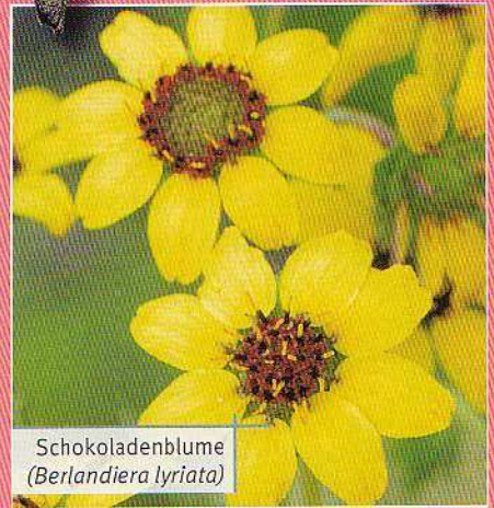
Schokoladenblume ( Berlandiera lyrata )