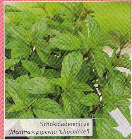
Schokoladenminze ( Mentha × piperita 'Chocolate')