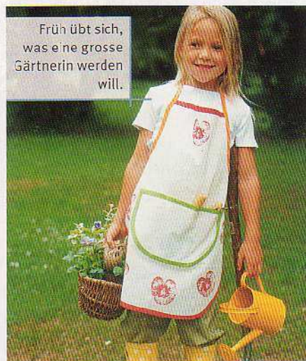
Früh übt sich, was eine grosse Gärtnerin werden will.