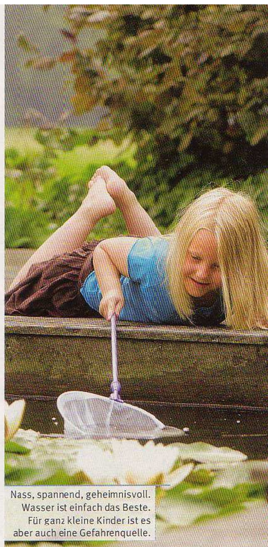
Nass, spannend, geheimnisvoll. Wasser ist einfach das Beste. Für ganz kleine Kinder ist es aber auch eine Gefahrenquelle.

Reiche Erntefreuden im eigenen Garten – mit ein paar einfachen Vorkehrungen ist das gar nicht so schwer. Sehr zur Freude der Kleinen und der Grossen!