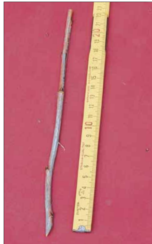
Je nach Gehölzart wird das Steckholz auf eine Länge von 20 bis 25 Zentimeter gekürzt.