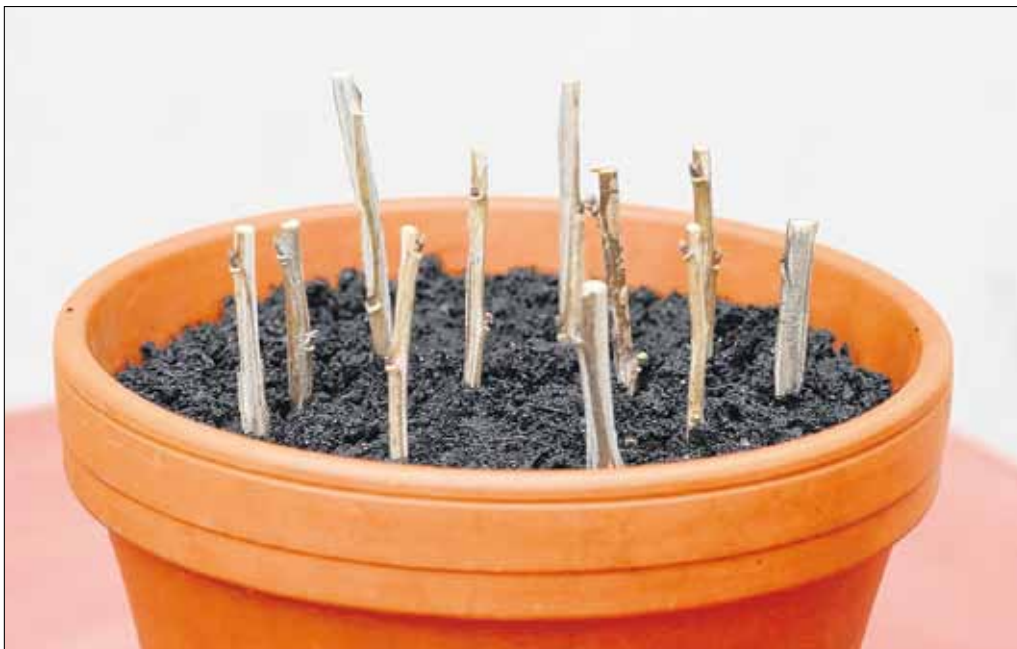
Die Steckhölzer werden bis zu \frac{1}{5} ihrer Länge in das Pflanzsubstrat gesetzt. Töpfe sollten bei Frost allerdings nicht draussen stehen bleiben.

gefroren, können die Steckhölzer im Gemüseschrank zwischengelagert werden. Packen Sie sie dazu in einen Plastikbeutel mit feuchtem Sand. Wird als Kinderstube ein Topf gewählt, sollte dieser bis zum Frühling im Gewächshaus oder in einem küh-