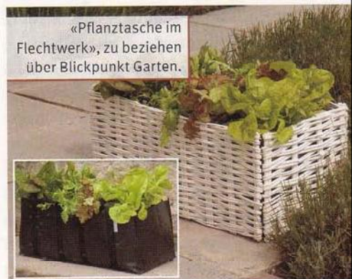
«Pflanztasche im Flechtwerk», zu beziehen über Blickpunkt Garten.