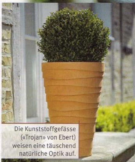
Die Kunststoffgefässe («Trojan» von Ebert) weisen eine täuschend natürliche Optik auf.

Egal ob Staude oder Gehölz, fast jedes Gewächs bietet sich hierfür an – vorausgesetzt, das Pflanzgefäss ist ausreichend gross. Vor dem Kauf sollte geklärt werden, ob die Lieblingspflanze tatsächlich für eine Kübelhaltung geeignet und frosthart ist. Der jeweilige Standort grenzt die Auswahl ein. Der Garten mediterranen Stils ist auf Sonne angewiesen, wohingegen schattige Bereiche der ideale Platz für Blattschmuckstauden sind. Funkien gedeihen übrigens hervorragend in Kü-