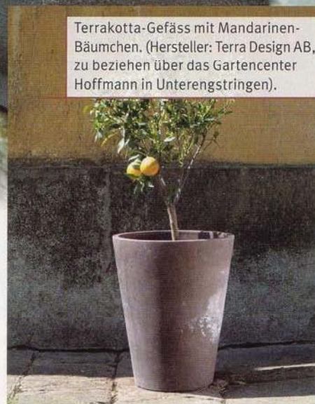
Terrakotta-Gefäss mit Mandarinen-Bäumchen. (Hersteller: Terra Design AB, zu beziehen über das Gartencenter Hoffmann in Unterengstringen).

Egal ob Staude oder Gehölz, fast jedes Gewächs bietet sich hierfür an – vorausgesetzt, das Pflanzgefäss ist ausreichend gross. Vor dem Kauf sollte geklärt werden, ob die Lieblingspflanze tatsächlich für eine Kübelhaltung geeignet und frosthart ist. Der jeweilige Standort grenzt die Auswahl ein. Der Garten mediterranen Stils ist auf Sonne angewiesen, wohingegen schattige Bereiche der ideale Platz für Blattschmuckstauden sind. Funkien gedeihen übrigens hervorragend in Kü-