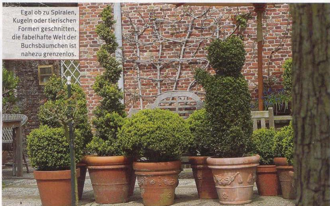
Egal ob zu Spiralen, Kugeln oder tierischen Formen geschnitten, die fabelhafte Welt der Buchsbäumchen ist nahezu grenzenlos.

beln, und auch Buchs oder Efeu lassen sich schön kombinieren. Zusätzliche räumliche Tiefe wird erreicht, wenn mit verschiedenen Höhen gearbeitet wird. Auf Tischen, Stühlen oder Treppchen arrangiert, sind solcherart gestaltete Buchs- und Efeutöpfe eine Augenweide.