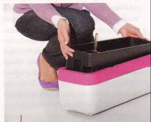
MyBox von Emsa bietet 25 unterschiedliche Farbkombinations-Möglichkeiten. Und die Bewässerung ist gleich inklusive! (Beziehbar über Wohnraum Garten).